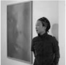
オノデラユキの作品「オノデラユキ」の展示風景。