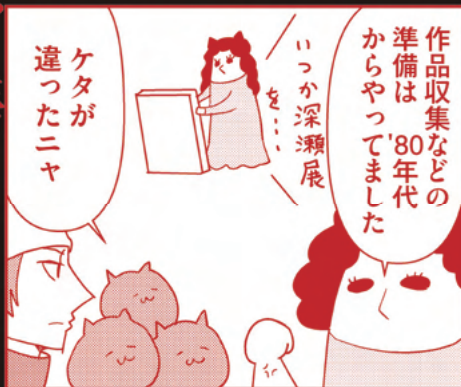
担当学芸員：スズキヨシコ