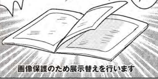
画像保護のため展示替えを行います